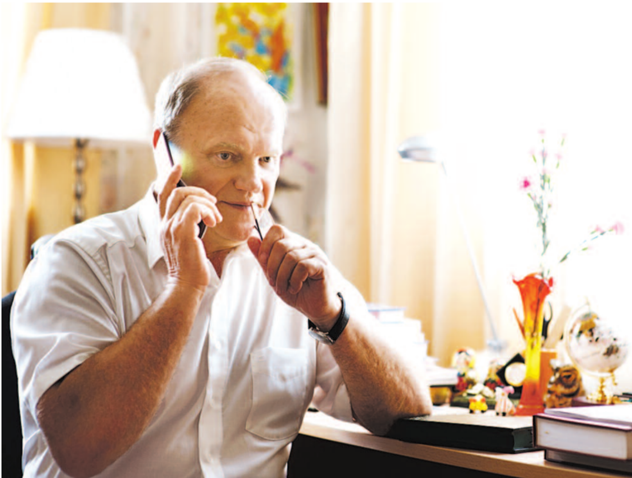
● НА ФОТО: КАНДИДАТ В ПРЕЗИДЕНТЫ РОССИЙСКОЙ ФЕДЕРАЦИИ, ЛИДЕР КПРФ ГЕННАДИЙ ЗЮГАНОВ